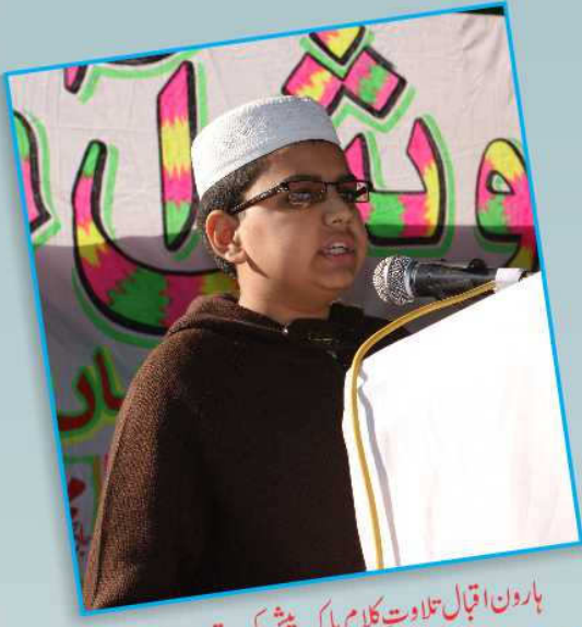
بارون اقبال تلاوت کلام پاک پیش کرتے ہوئے۔