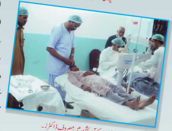
مریشوں کے آپریشن میں مصروف ڈاکٹرز۔