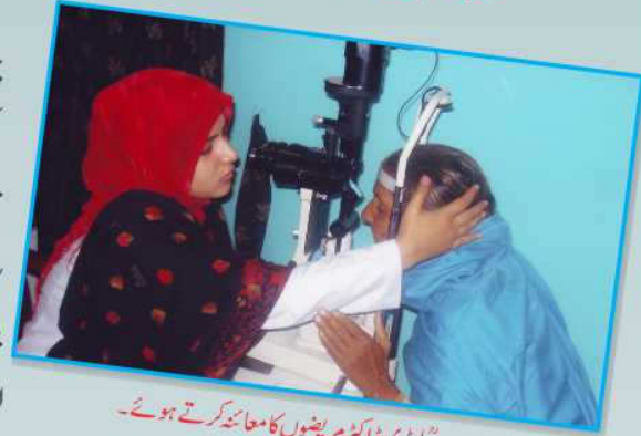
ڈاکٹر مریشوں کا معائنہ کرتے ہوئے۔